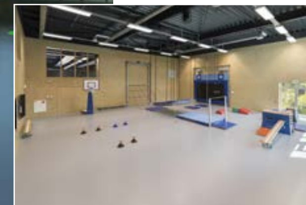
Kracht van de Beweegbox: naast projectie kun je ook toestellen opstellen in de zaal.

De Beweegbox biedt ruimte aan zowel traditionele, moderne als toekomstgerichte beweegvormen voor alle leeftijden. Maar dan op een nieuwe, slimme en aantrekkelijke manier. MVIE is als audiovisueel partner nauw betrokken bij de Beweegbox.