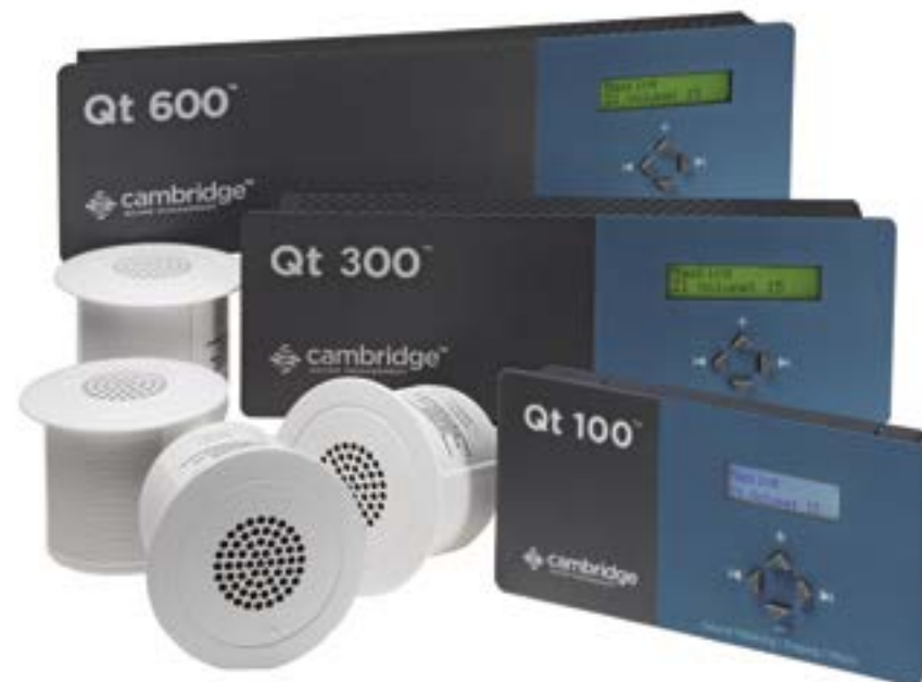
Het Cambridge Sound Masking Systeem.